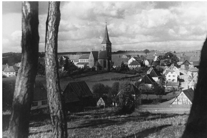
Blick auf Münchaurach

Hinweis: 'weitere Fotos von früher finden Sie unter http://bilder.aurachtal.de '