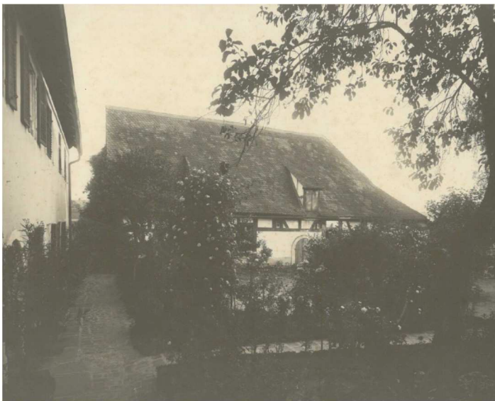
Pfarrhaus und Gemeindehaus

Hinweis: 'weitere Fotos von früher finden Sie unter http://bilder.aurachtal.de '